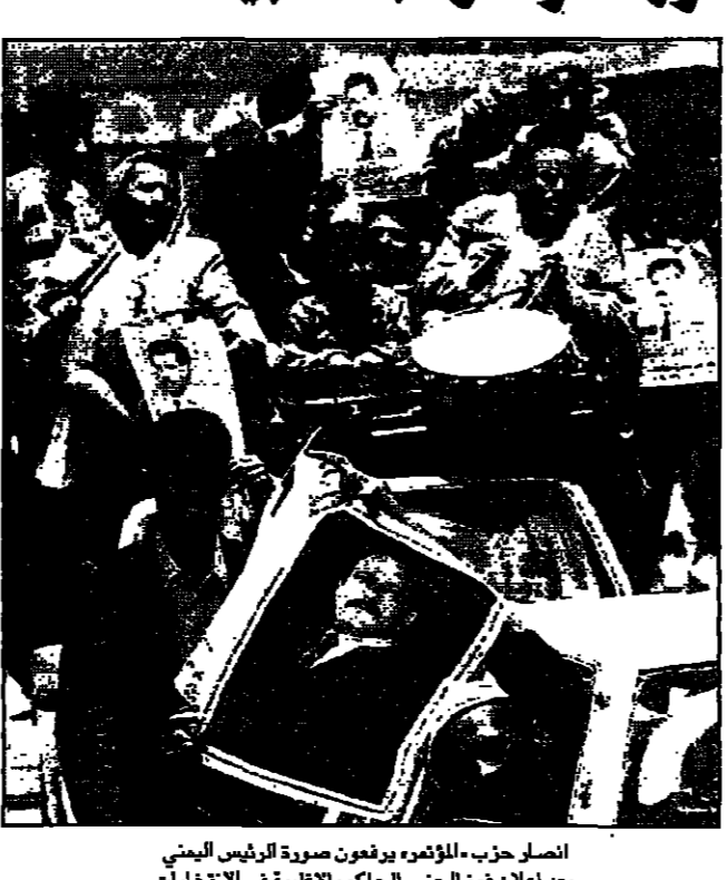
انصار حزب المؤتمر يرفعون صورة الرئيس اليمني بعد اعلان فوز الحزب الحاكم بالانتخابات

■ صنعاء - القدس العربي - من محمود معروف: واصل التجمع اليمني للإصلاح اجتماعاته الطارئة مساء أمس وهدد بسحب أعضائه من البرلمان، بعد إعلان فوز حزب المؤتمر الشعبي العام بالأغلبية المطلقة في مجلس النواب الجديد. واعتقدت اللجنة العليا للانتخابات في اليمن فوز المؤتمر بـ 29 مقعدا و 17 مقعدا من مقاعد مجلس النواب، وهو ما يعطيه أغلبية مطلقة في المجلس.